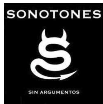
Sin Argumentos 2006