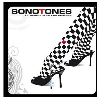
La rebelión de las monjas 2010

Y VIVIR EL SALTO MORTAL: Llegó la noche y se apagó la luz, ahora sí, llegan los "SONOTONES" con las armas que dan la vida. Te enganchaste y la cagaste, a mí me pasó lo mismo, la tensión de las guitarras, las melodías desgarradoras, la fuerza, el calor... Y me encontré bebiendo a contrarreloj con gente de mala reputación, sé que volví porque he dormido aquí... días de vértigo.