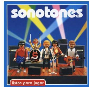
Listos Para Jugar 2000

El segundo trabajo se llamó LISTOS PARA JUGAR . Fue grabado entre noviembre y diciembre del año 2000 en los estudios Infinity de Madrid, producido por Daniel Alcover (quien grabó "Devil come to me" de Dover, La Vaca Azul, Amparanoia, Superskun, etc.). Un disco con doce canciones de corte más rockero si cabe, y más vacilón, y sobre todo con un sonido más consolidado y mucho más personal. Entre el descaro y fuerza de los grupos escandinavos (Hellcopters, Backyard Babies, Glucifer, etc.), la chulería de los Enemigos y las melodías de voz de Posies, una mezcla más que curiosa y esperada en el encorsetado mundo del Rock cantado en castellano. Quien lo escucha tres veces, lo vuelve a escuchar otras ochenta, porque engancha.