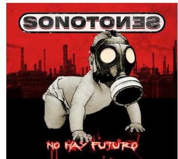
No hay futuro 2016

Si en el anterior trabajo, la temática en algunas canciones resultaba más obvia, en este disco se observa un trabajo concienzudo que mezcla la poesía de la calle con el interior desgarrado más íntimo.