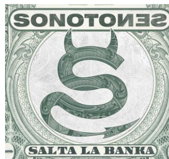
Salta la banka 2014

"Europa está matándome", "Ni contigo ni sin ti", "¡Que escéptico!", "Hay que salir", "Salta la Banka", "Sólo tienes una vida", "El rey", "La vida sigue igual", "La hora sexta", "Justo lo contrario", "Para siempre", 11 temas comprometidos y contundentes.