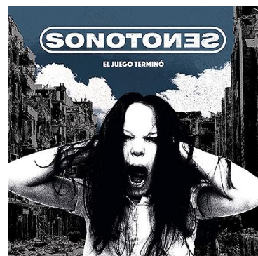
El Juego Terminó 2018